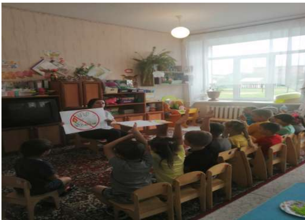
Просмотр познавательного мультфильма «Эколята – защитники природы!»