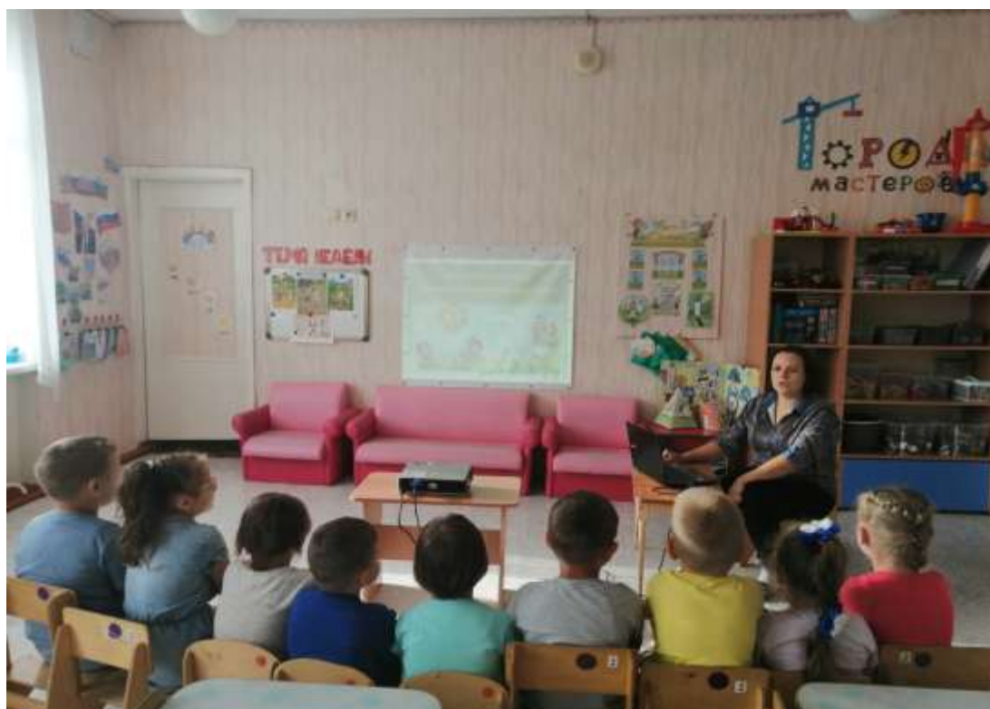
Познавательное развитие «Мы – природе друзья!»