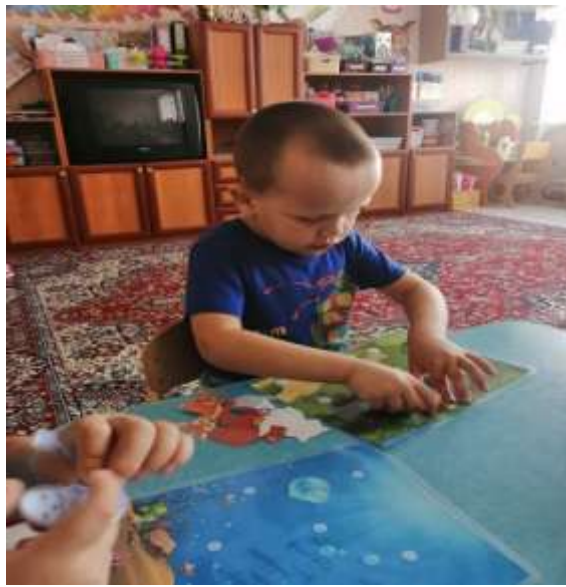
Создание экологической игры «Веселые крышечки»