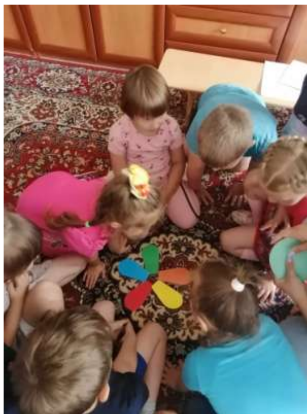
Познавательное развитие «Кто такие эколята?»