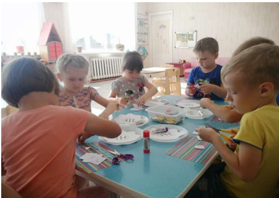
Создание коллективного плаката «Береги свою планету!»